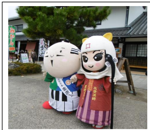
左 出世大名 家康くん 右 出世法師 直虎ちゃん

9月に1名、10月に1名、11月に1名の新会員の入会がありました。12月10日(日)午後5時より支部役員会をその後新会員歓迎会と忘年会を和風料理「隈家(くまや)」で会費3,000円で行います。幹事は村上副支部長(852-8701)です。みなさんの参加をお待ちしております。